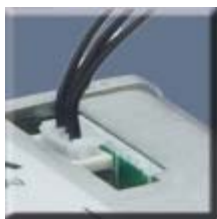
Standaard uitvoering SELO-B